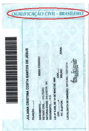
Figura 5: Página de qualificação civil.