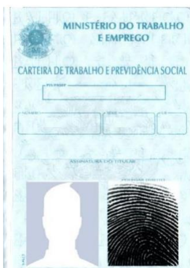
Figura 4: Página de identificação.