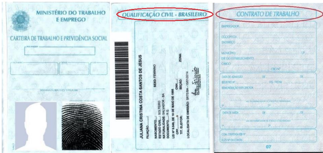
Figura 3: Página de identificação.