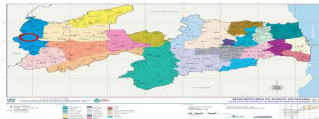
Figura 3 – Microrregiões do Estado da Paraíba. (Secretaria de Ciência e Tecnologia e Meio Ambiente do Estado da Paraíba – SECTMA - PB)

O município de Cajazeiras limita-se a Oeste com Cachoeira dos Índios e Bom Jesus, ao Sul São José de Piranhas, a Noroeste Santa Helena, a Norte e Leste São João do Rio do Peixe e a Sudeste Nazarezinho. Ademais, localiza-se há pouco mais de 40km da cidade de Sousa e também, devido à proximidade fronteiriça, atende estudantes oriundos de cidades do interior dos estados do Ceará e Rio Grande do Norte e isto se atribui, ao mesmo tempo, ao seu vasto campo influência econômico e cultural.