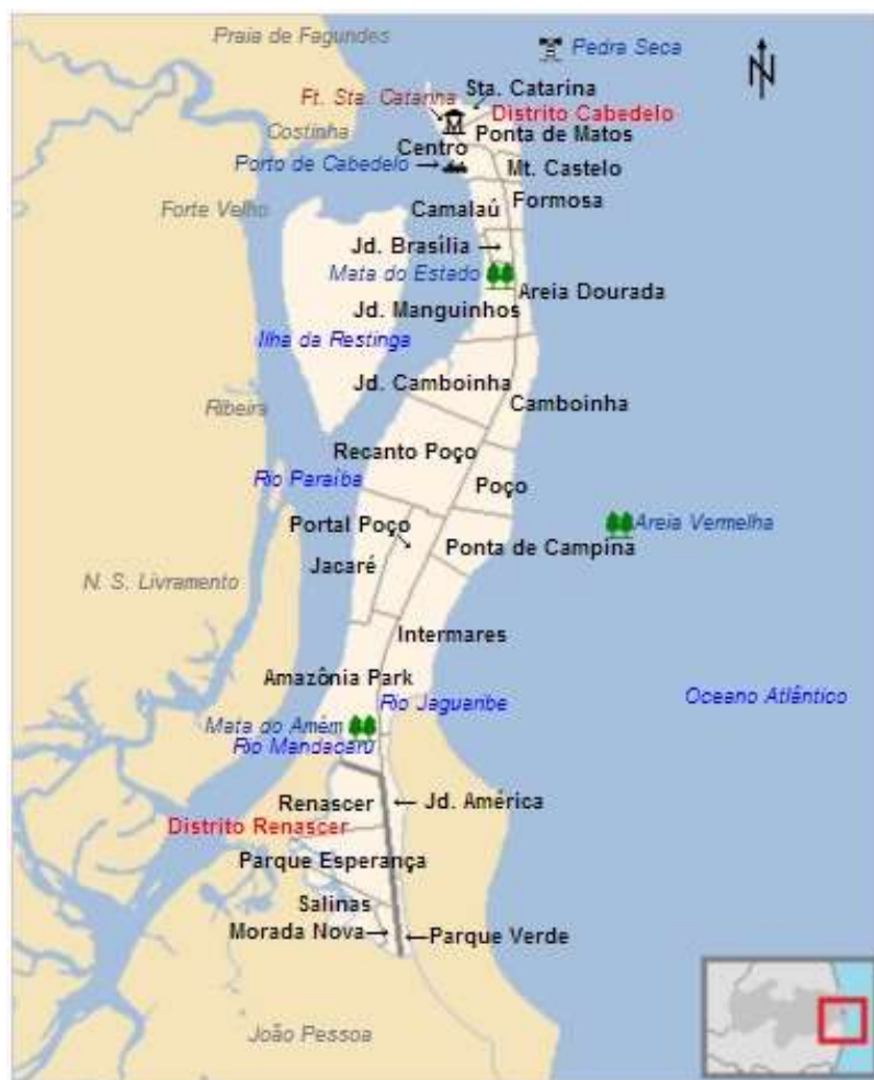
Figura 3. Mapa territorial da cidade de Cabedelo, Paraíba.

O município está incluído na área geográfica de abrangência da zona fisiográfica do litoral paraibano. Insere-se na unidade geoambiental dos Tabuleiros Costeiros. Possui aproximadamente 15 quilômetros de costa com praias urbanizadas. Tem, ainda, todo o estuário do rio Paraíba, com mangues. A Ilha da Restinga é parte integrante do município.