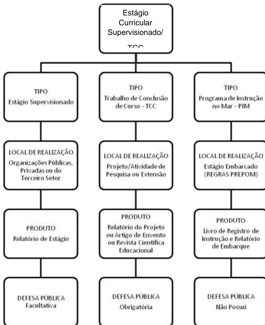
Fluxograma de Estágio

Avenida João da Mata, nº 256 – Bairro Jaguaribe – João Pessoa – Paraíba – CEP: 58015-020 (83) 3612-9703 – conselhosuperior@ifpb.edu.br