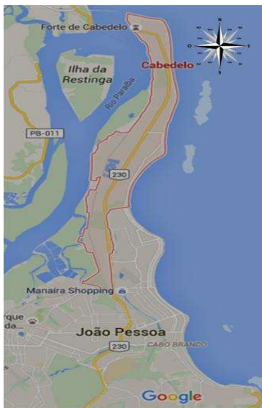
Figura 2. Delimitações do município de Cabedelo, PB. Adaptado do google Maps.

De acordo com dados do IBGE (2010), Cabedelo tem uma área territorial de aproximadamente 32 km 2 ; está localizado nas coordenadas geográficas de latitude 6° 58' 21" S e longitude 34° 50' 18" W. Na Figura 2 é mostrado as delimitações do município de Cabedelo.