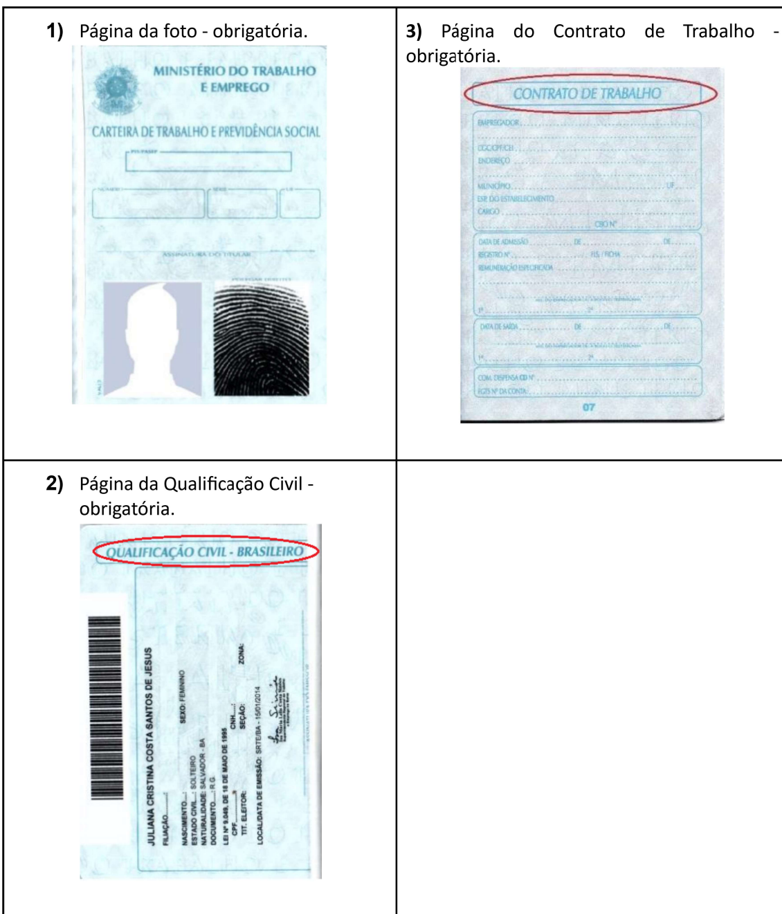
Figura 4: Página de identificação.