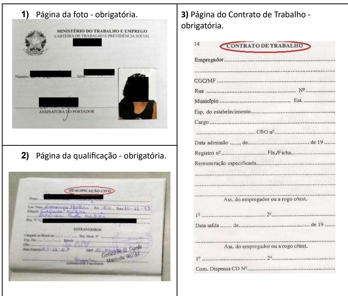
Figura 1: Página de identificação.