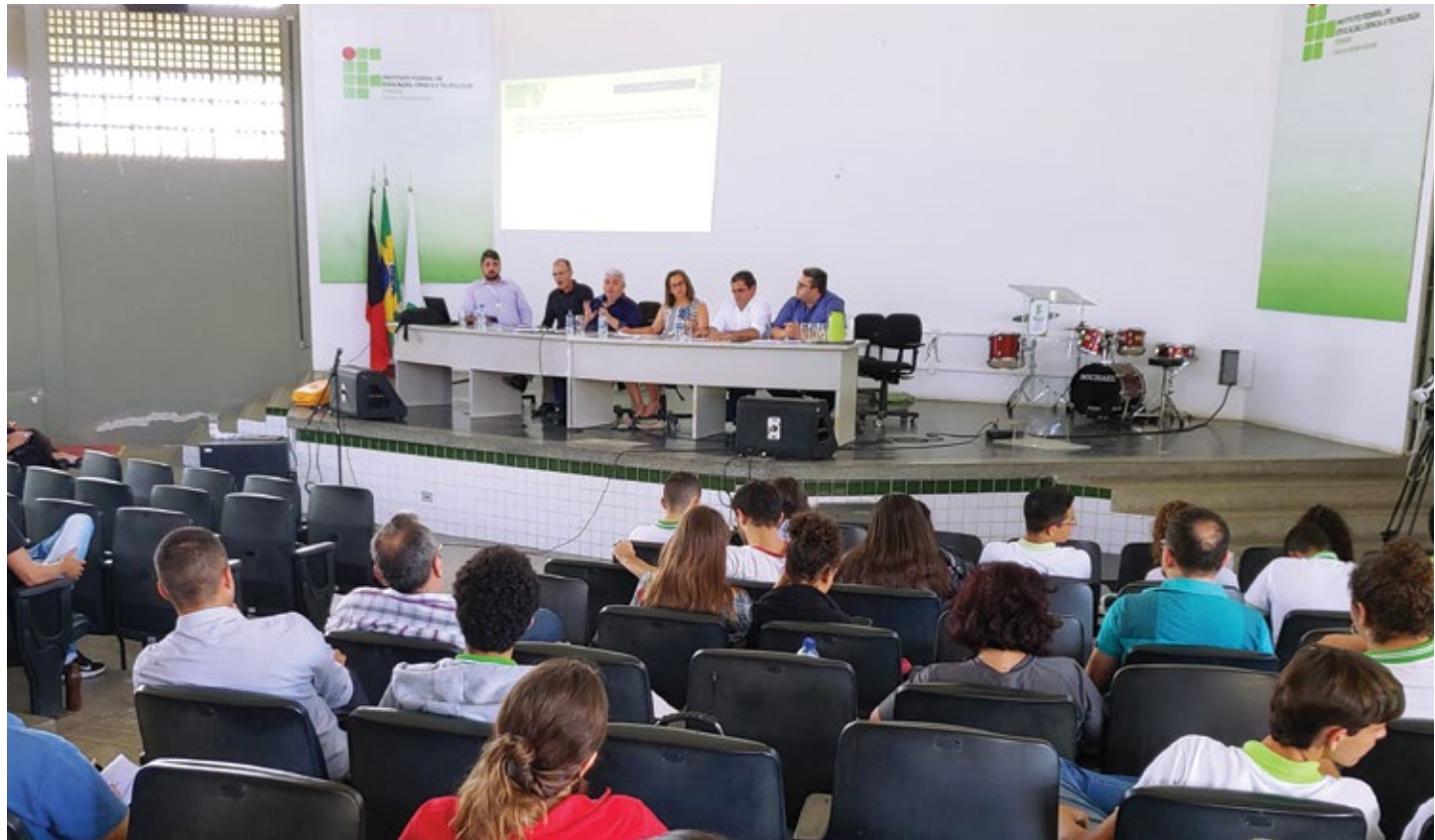
Reuniões tiveram amplo debate com a comunidade

Esperança, Areia, Campina Grande e Picuí foram os campi que receberam a primeira visita do Programa em 2019, com ampla participação da comunidade acadêmica