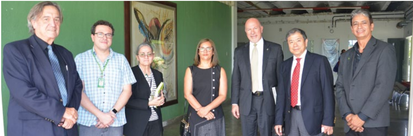
Comitiva de investidores visita o IFPB

Chineses e americanos visitam a Paraíba para viabilizar o funcionamento de um estaleiro para reparos navais e contam com a formação técnica e profissional do IFPB