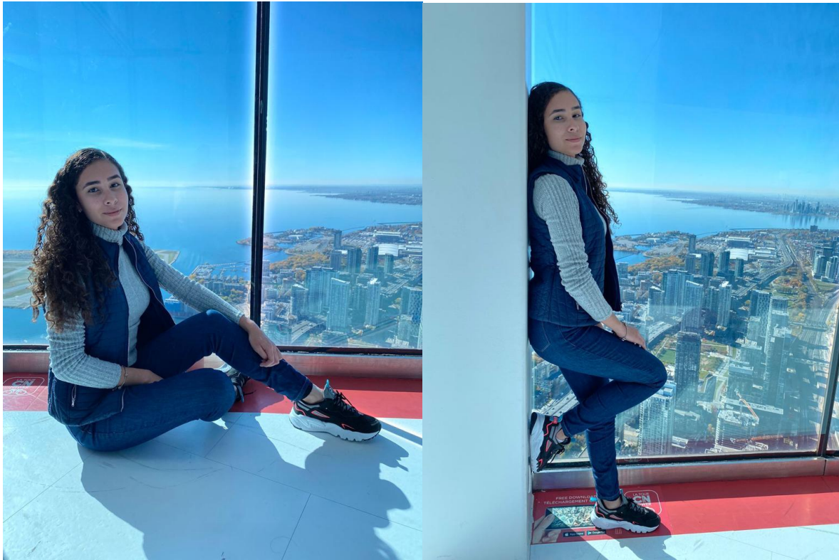
Letreiro de Toronto