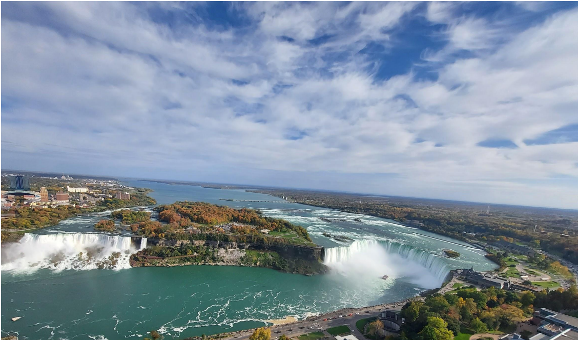
Foto da torre onde fica possível ver a queda d'água da Catarata do Niágara