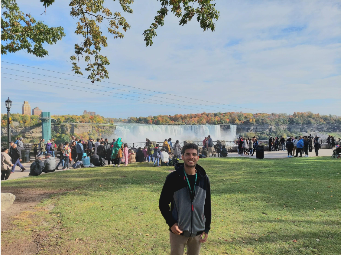
Foto em Niagara Falls