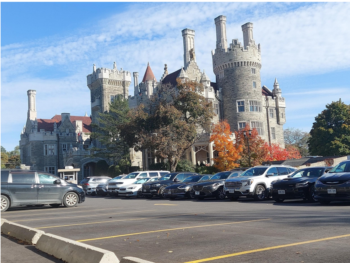
Mais uma foto tirada de outro ângulo da Casa Loma