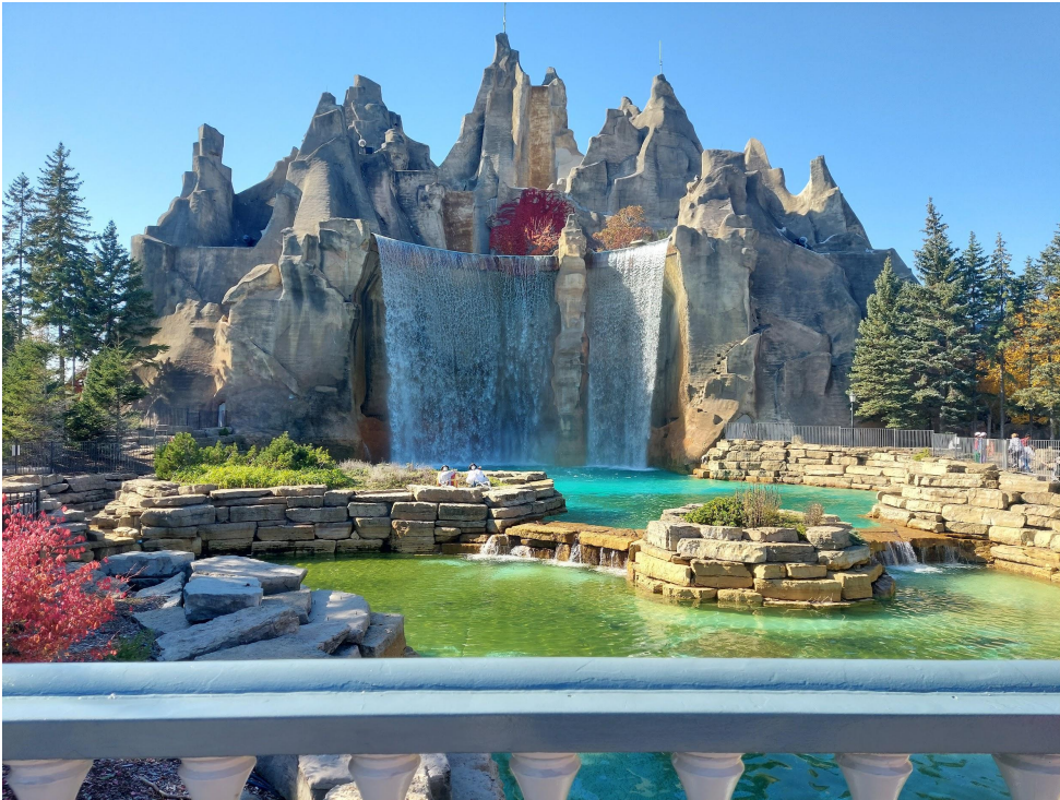
Foto tirada no Canada's Wonderland