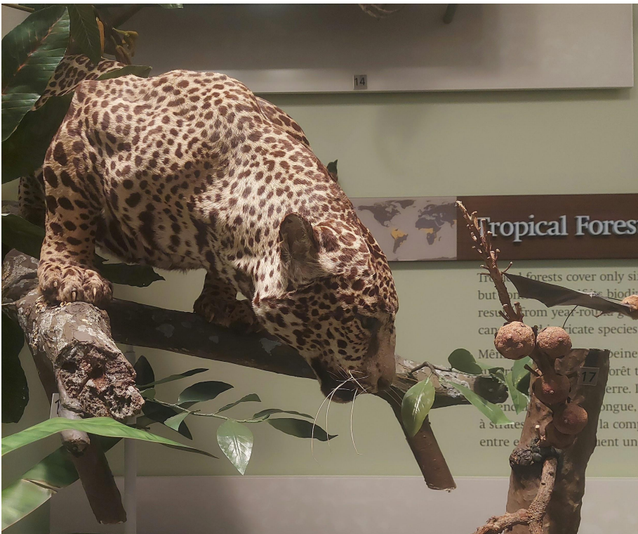
Foto de uma onça pintada também tirada no museu Royal Ontario Museum