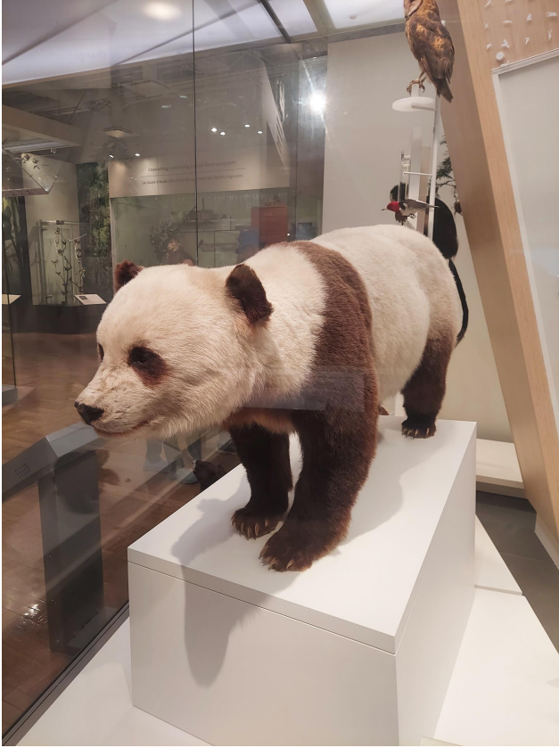
Foto de um urso panda tirado no Museu Royal Ontario Museum