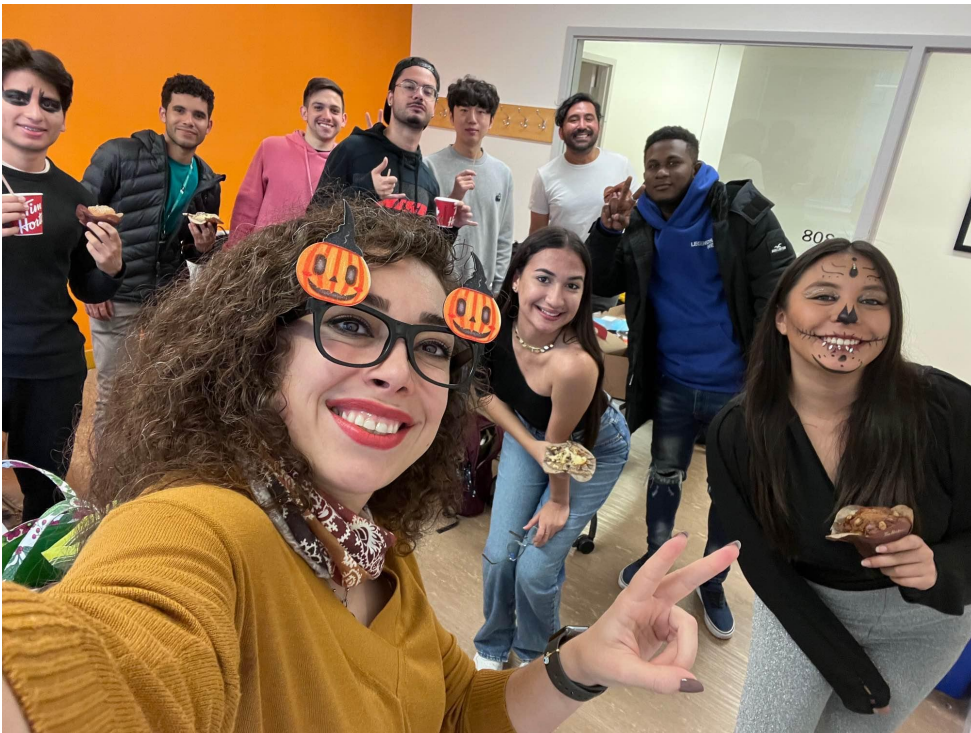
Foto tirada na escola ILSC no dia do halloween