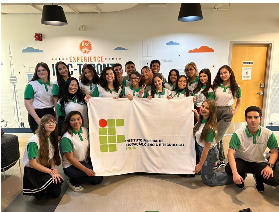
Foto do Último dia na escola ILSC