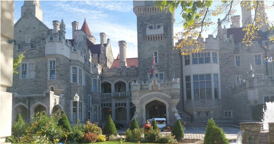
Foto tirada na visita a Casa Loma