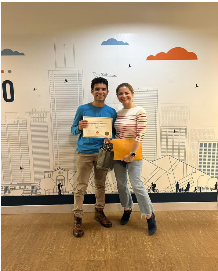
O momento que eu recebi o certificado do curso de Inglês na ILSC