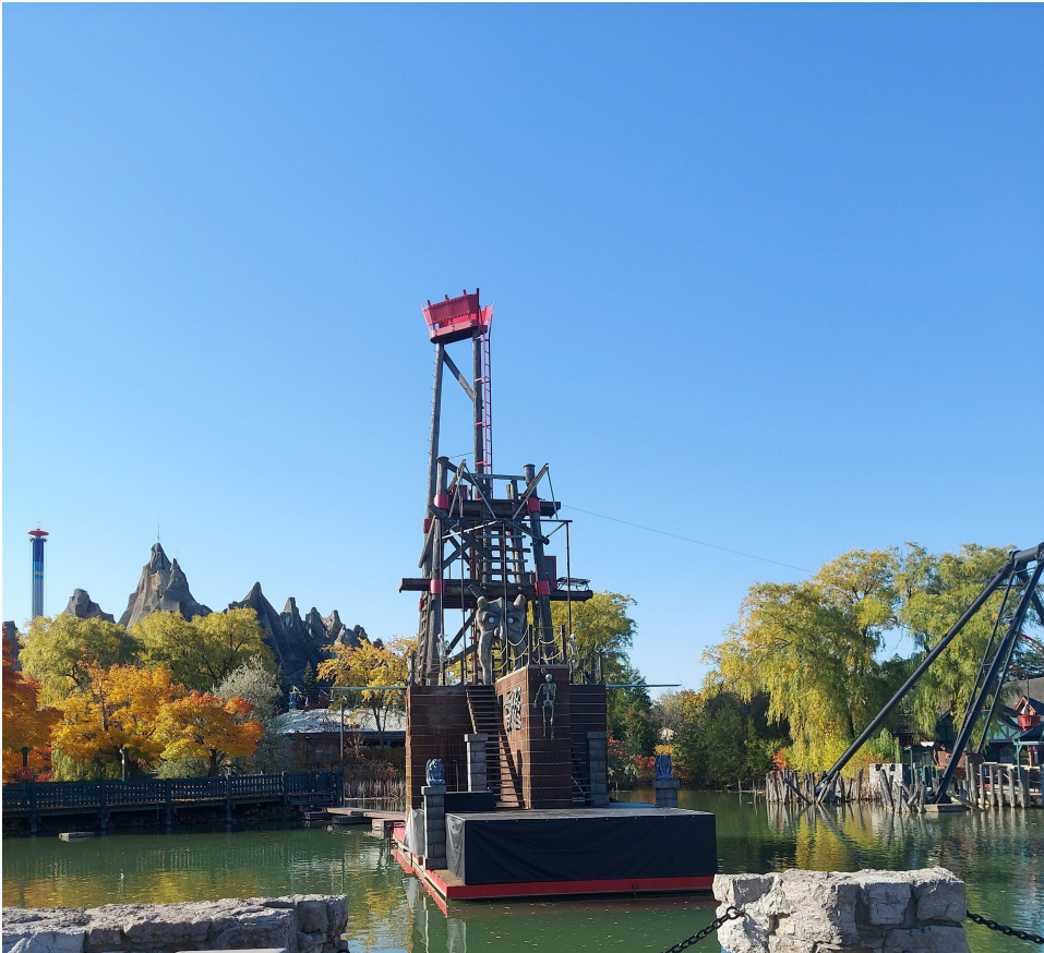
Foto tirada no Canada's Wonderland