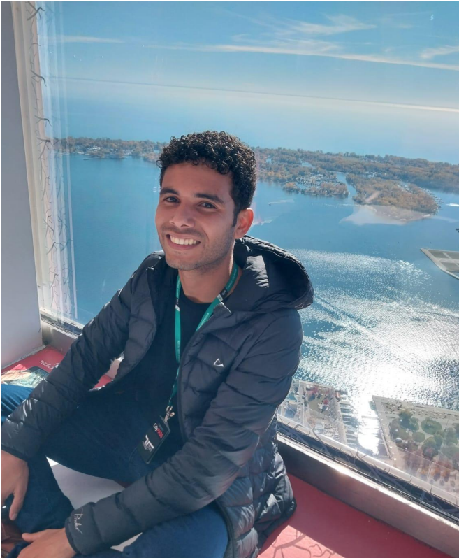
Foto minha tirada na CN Tower