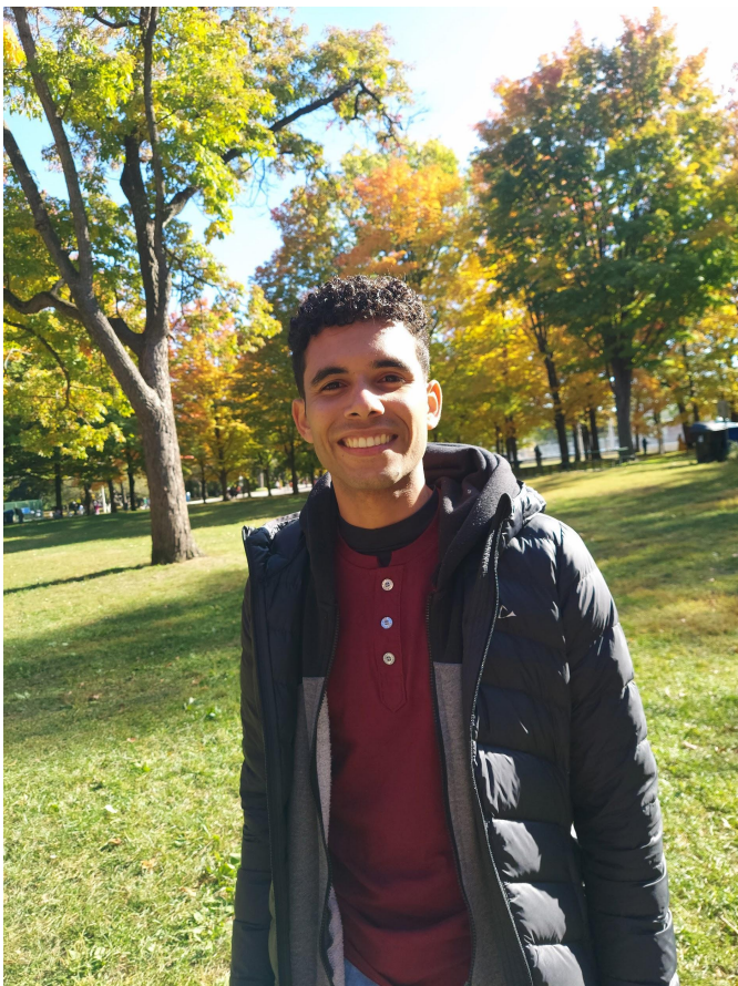
Foto minha no High Park