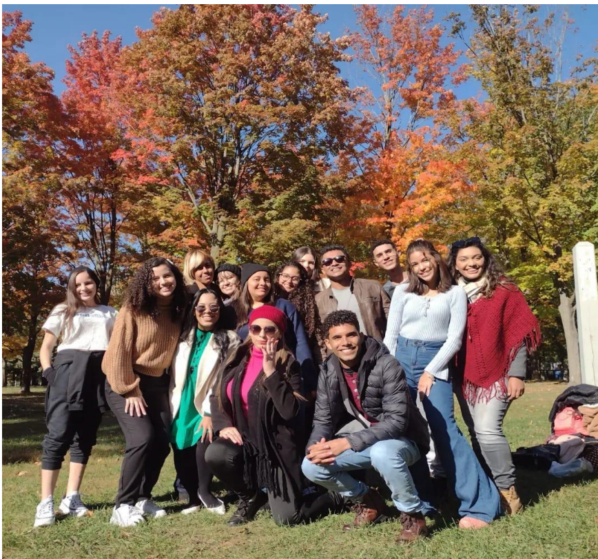
Foto no High Park