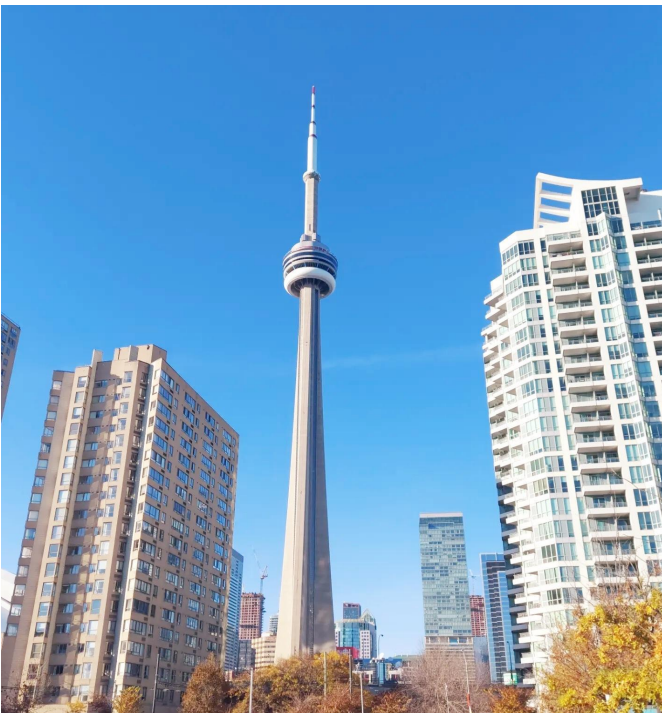
Foto da CN Tower