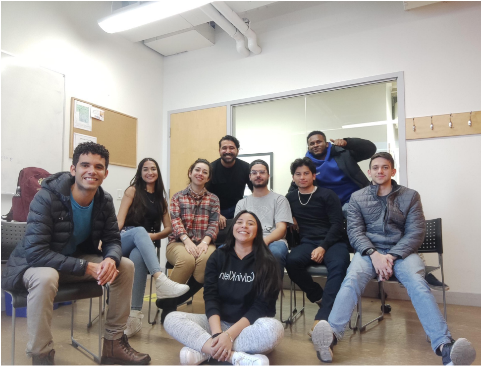
Foto na sala de aula da ILSC com a professora de Gramática e os colegas de sala