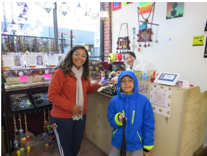
Loja artesanal turca no Kensington Market