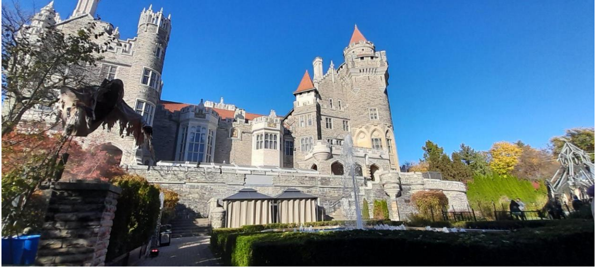
Vista do jardim da Casa Loma