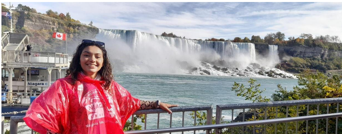
Uma das quedas-d'água de Niagara Falls