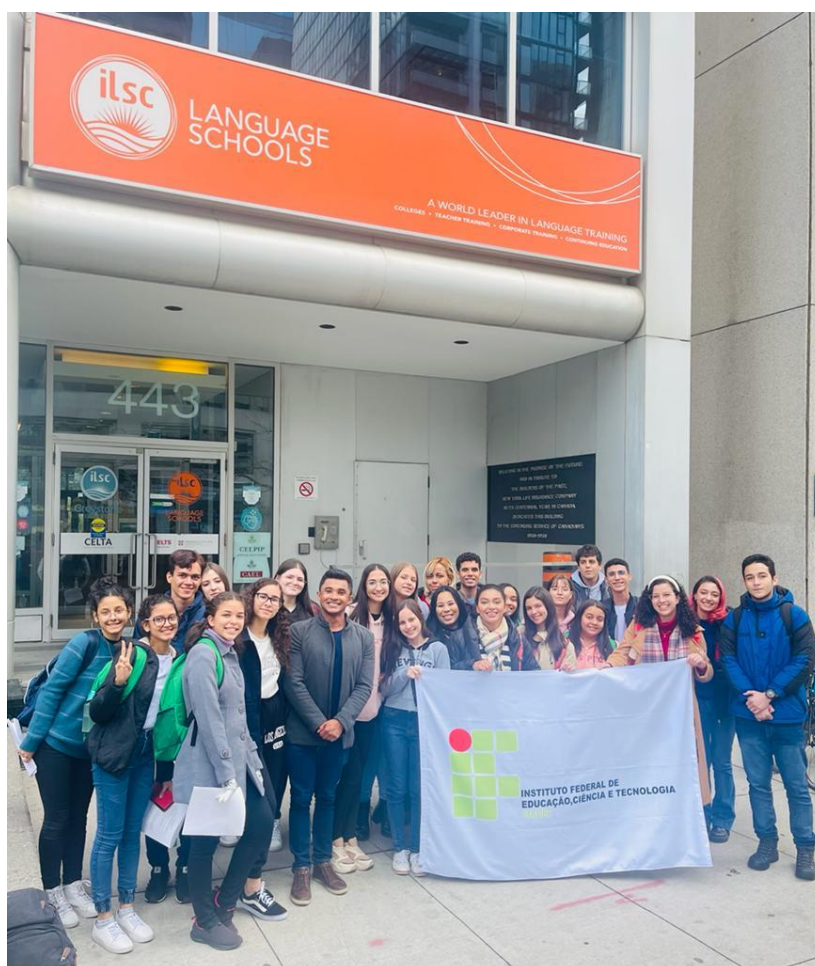
Grupo do IFPB 2022 na fachada da ILSC