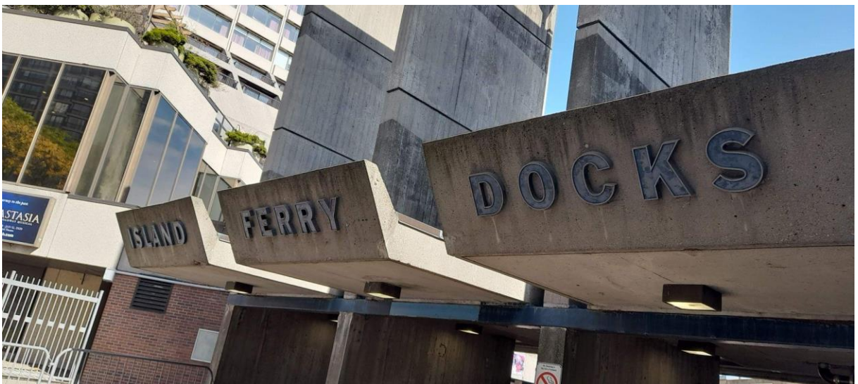
Entrada para as balsas que trafegam até Toronto Island