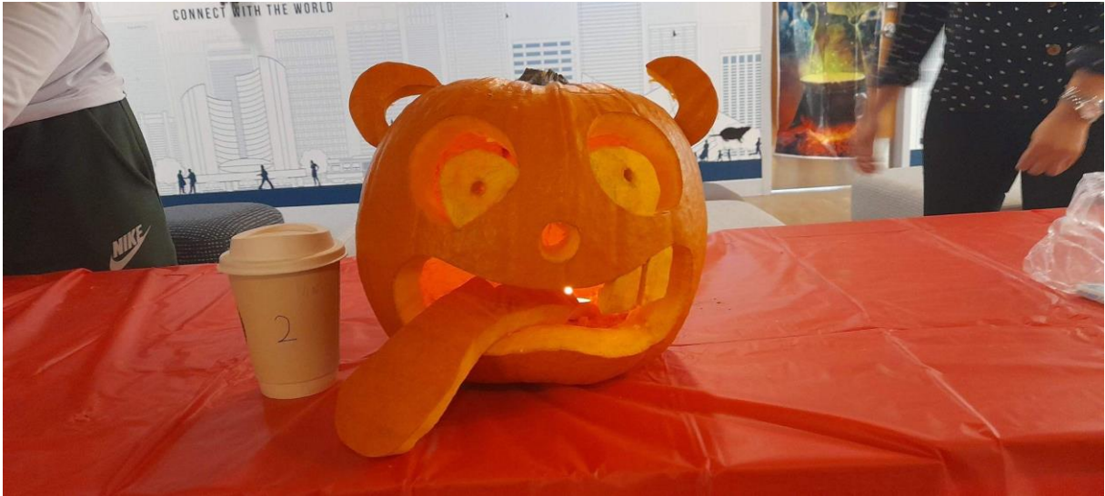
Abóbora decorada pela minha turma

Outra data comemorativa é o Halloween, 31 de outubro, dia também em que muitas pessoas por onde passávamos estavam fantasiadas. A ILSC realizou uma competição de abóboras decoradas entre as turmas e um concurso de fantasias, que eu tive a alegria de participar e ganhar um gift card do Starbucks e uma caneca com a logo da escola.