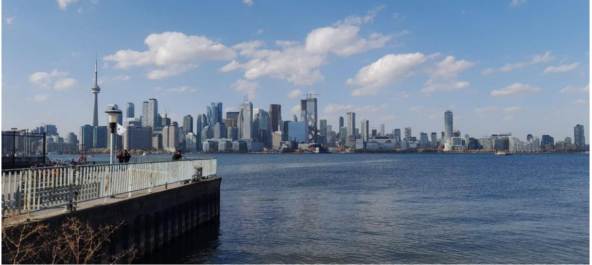
Vista de Toronto a partir de Toronto Island