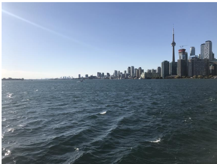
Ilustração 2 – Vista da Cidade de Toronto

(Fotografia retirada durante o passeio à Toronto Islands : Ilhas do lago Ontário formadas pela ação de um furacão)