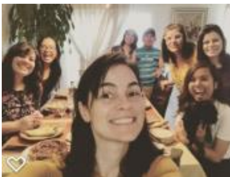
Ilustração 4 – Celebração do Thanksgiving Day com a família da Homestay

A principal atividade de convívio com a família, foi o feriado do Thanksgiving Day . É o dia de ação de graças, que ocorre no dia 09 de outubro para celebrar um dia de gratidão a Deus, com orações e festas pelos bons acontecimentos ocorridos durante o ano.