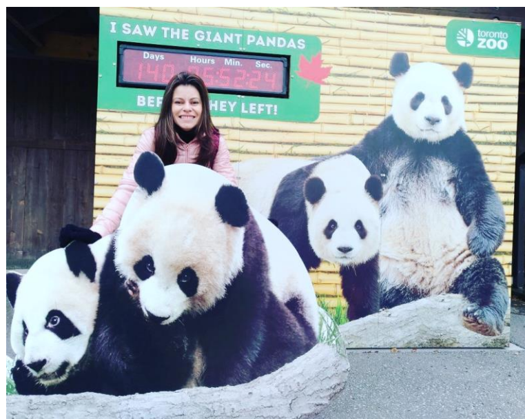
Ilustração 12 – Principal atração do zoológico de Toronto.