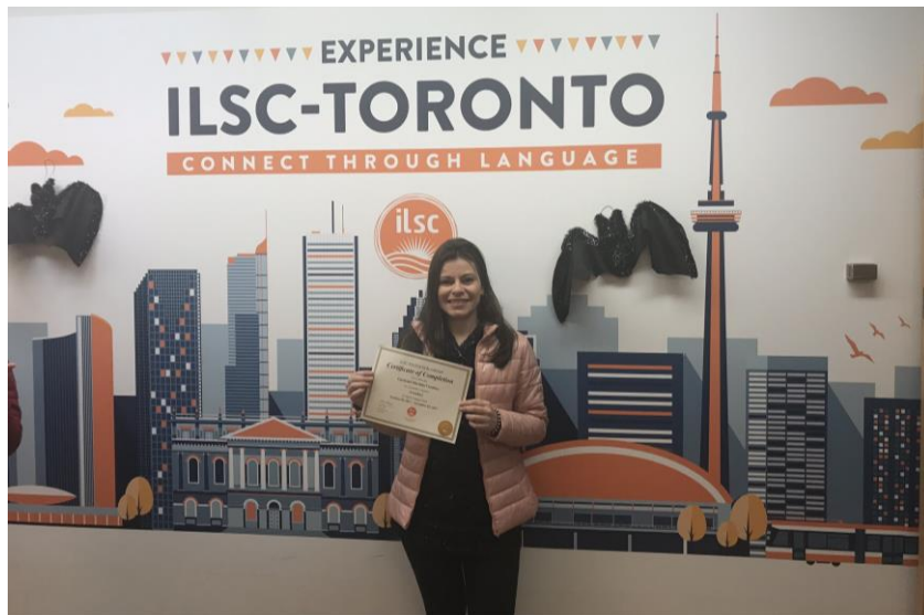
Ilustração 19 – Recebendo a certificação no último dia de atividades na ILSC

Ao término das quatro semanas de curso, com aulas em duas turmas nos turnos manhã e tarde, a escola fez a certificação dos alunos, apresentando um relatório com as principais habilidades desenvolvidas e um parecer do professor sobre o desenvolvimento do aluno emitido pelo professor responsável.