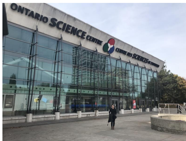
Lustração 10 – Centro de Ciências de Ontário

O centro de ciências de Ontário possui uma enorme variedade de exposições interativas principalmente nas áreas de física e biologia. O centro de ciências recebe diariamente alunos de escolas de ensino fundamental, mas é um espaço de aprendizado para todas as idades.