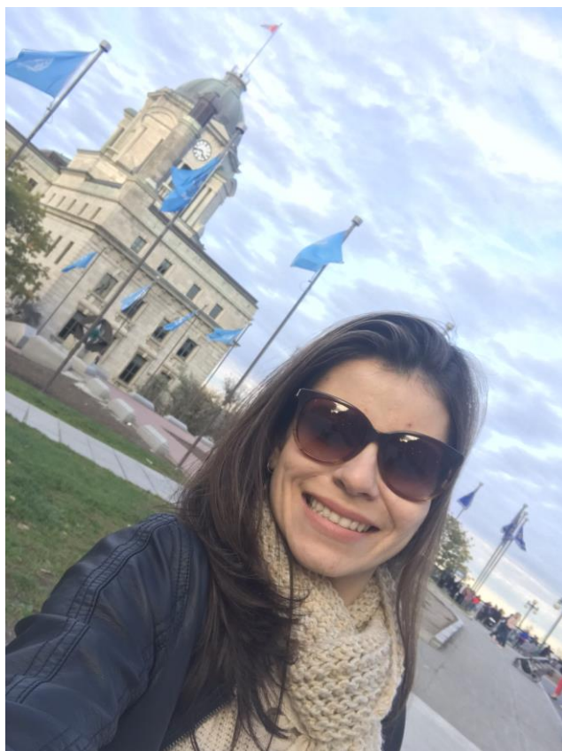
Ilustração 16 – Centro histórico de Quebec

Por fim, foi visitada a histórica e lindíssima cidade de Quebec, onde as temperaturas mais baixas do outono foram ser sentidas.