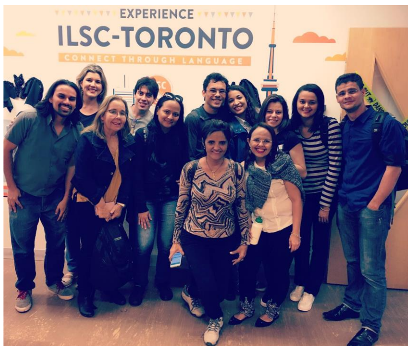
Ilustração 3 – Servidores do intercâmbio do IFPB na ILSC - Toronto