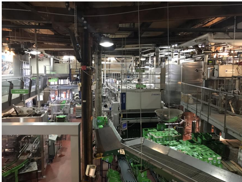
Ilustração 18 – Visão geral do processo produtivo na Cervejaria Steam Whistle

Foi possível visitar todo o processo de produção e o laboratório onde são realizadas as análises para o controle de qualidade.