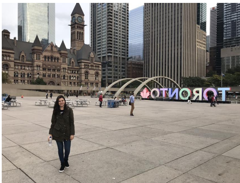
Ilustração 1 - Nathan Phillips Square

Toronto é uma das cidades mais multiculturais e cosmopolitas do mundo. A população diversificada reflete seu papel atual e histórico como um destino importante para os imigrantes no Canadá, com quase 50% dos residentes pertencentes a um grupo populacional de minorias visíveis, e mais de 200 origens étnicas distintas representadas entre seus habitantes.