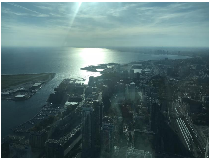
Ilustração 6 – Fotografia tirada do topo da CN Tower