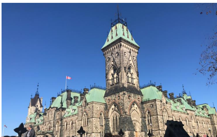
Ilustração 13 – Prédio principal no parlamento canadense - Ottawa

Na ocasião foi visitada a quarta maior cidade e capital do país, Ottawa, localizada às margens do rio Ottawa e onde está localizado o parlamento canadense.