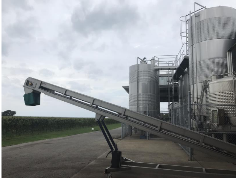
Ilustração 17 – Vinícola de Konzelmann - Niagara

Outra visita técnica foi realizada na cervejaria Steam Whistle, situada na antiga estação de manutenção de trens de Toronto, o que motivou o nome da empresa, que produz uma das principais cervejas da região.