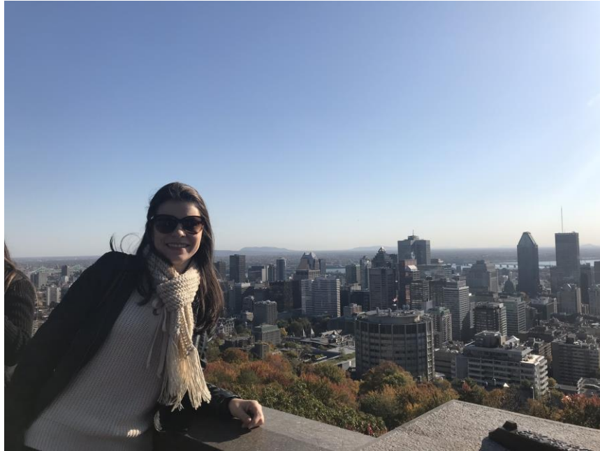
Ilustração 14 – Vista de Montreal do Monte Royal Parque

Outra grande atração da cidade é a basílica católica romana de Notre-Dame, inaugurada em 1829, famosa pela beleza, riqueza e grandiosidade.