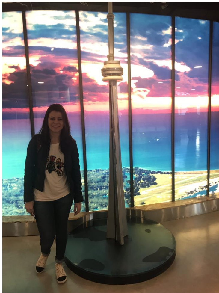
Ilustração 5 – Replicca da CNTower no complexo de visitação

A Torre CN ( Canadian National ) é uma torre turística e de comunicações que tem 553,33 metros de altura, sendo a terceira maior torre do mundo. Ela é o principal cartão postal de Toronto, pode ser vista de muitos lugares da cidade, servindo de referência para se localizar na região. A torre abriu suas portas para o público no dia 2 de junho de 1976 e, na época, era a estrutura mais alta do mundo. A CN Tower é considerada uma das 7 maravilhas do mundo moderno.