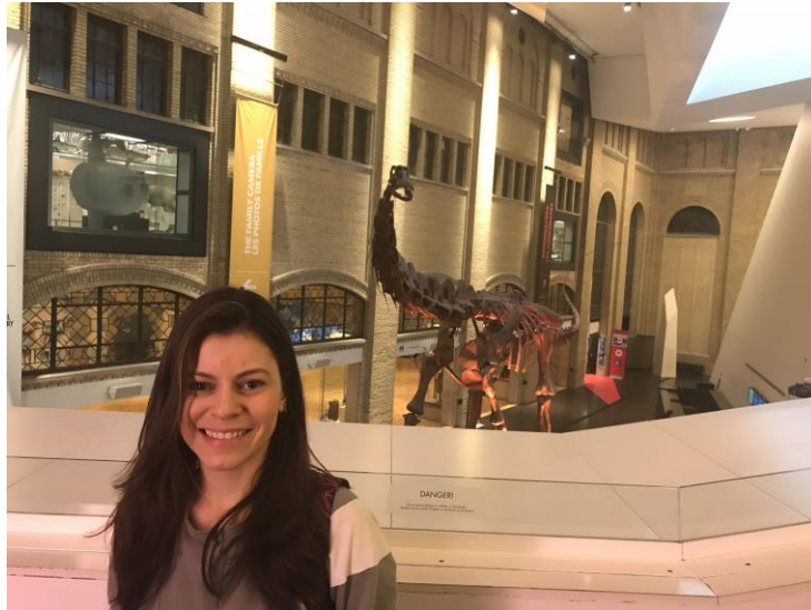
Ilustração 9 – Sala dos Dinossauros no Royal Ontario Museum

O museu Royal de Ontário possui um acervo vasto e variado de artes pura e aplicadas, ciências naturais e arqueologia. Entre tantas salas importantes, destacamos a sala dos dinossauros. O museu tem uma excepcional gama de galeria temática, que exploram culturas mundiais e história natural.