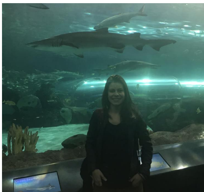
Ilustração 8 – Toronto Replays Aquarium

Foi impressionante ver toda a engenharia presente para manter a vida saudável de todos esses animais em cativeiro.