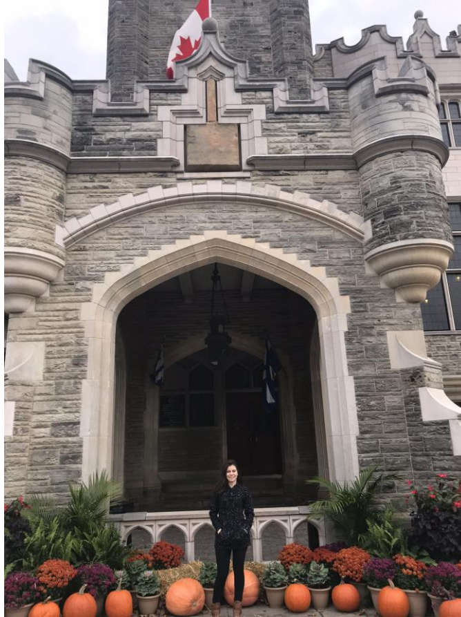
Ilustração 11 – Fachada principal da Casa Loma

A Casa Loma é um castelo que foi residência de um próspero homem de negócios, Sir. Henry Pellat. Durante a década de 30 a propriedade foi colocada a leilão e acabou sendo comprada pela prefeitura. Mais tarde, acabou sendo transformada em atração turística. O casarão é rico em detalhes históricos e arquitetônicos.