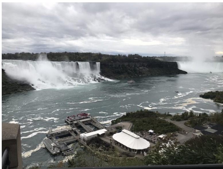
Ilustração 7 - Cataratas do Niágara